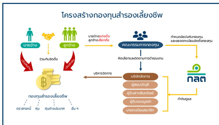
ภาพที่ 1 โครงสร้างกองทุนสำรองเลี้ยงชีพ

สภาพแวดล้อมทางด้านเศรษฐกิจ (สุปราณี นาคแก้ว, 2554) กล่าวว่า เครื่องชี้วัดสภาพทางเศรษฐกิจของประเทศใดประเทศหนึ่ง สามารถพิจารณาได้จากปัจจัยต่าง ๆ ได้แก่